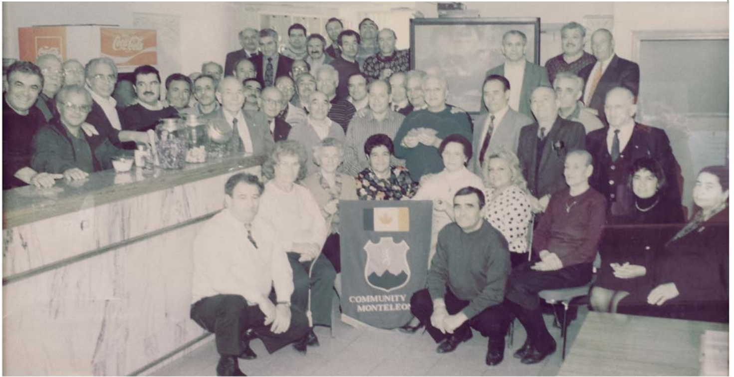
CLUB OPENING 1989