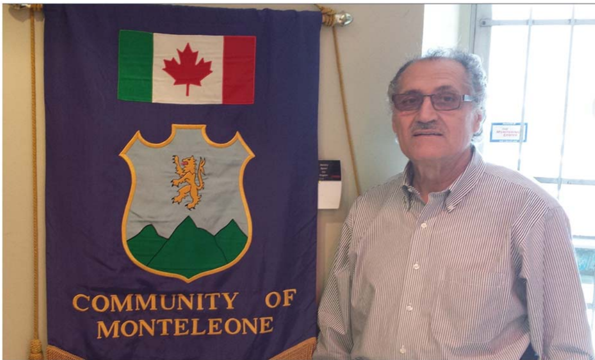
The Club Chartered a Plane to celebrate the 400th ANNIVERSARY OF MONTELEONE (IT)